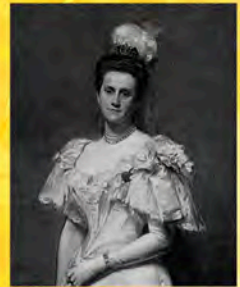
Emily Warren Roebling